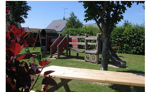
Mairie de Colombiers du Plessis