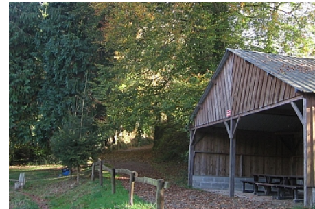
Mairie de Colombiers du Plessis

Vous serez séduit par les aires de pique-nique du village : aire couverte au bord du plan d'eau de la Graffardière ou dans le bourg.